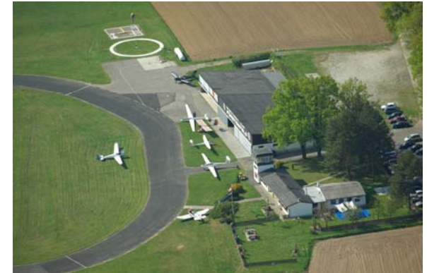
Unser Flugplatz LOGF

Wir praktizieren in Fürstenfeld den Flugzeugschlepp. Hierbei wird das Segelflugzeug von einem Schleppflugzeug in eine Thermik gezogen. In die Thermik heißt, dass ein Aufwindgebiet gesucht wird, in dem der Segler durch die aufsteigende Luft mitsteigen kann, und somit ohne eigenem Antrieb große Höhen erreichen kann.